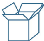
60 pz PER SCATOLA