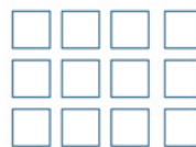
PEDANA DA 72 SCATOLE (6 STRATI DA 12 SCATOLE)